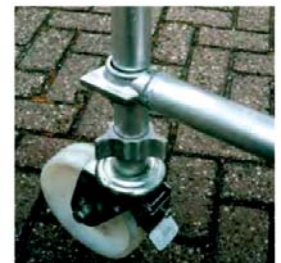
Výškovo nastaviteľné koleso s brzdou