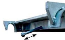
Bezpečnostná poistka podlážky